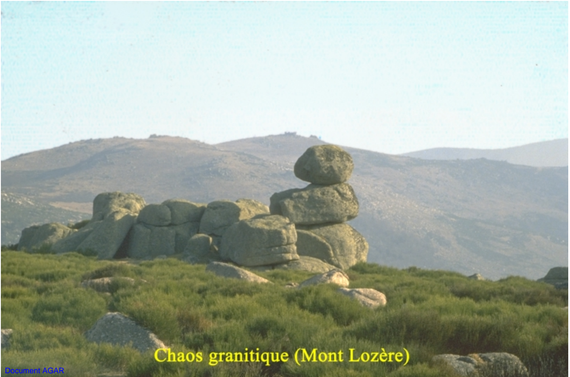
Chaos granitique (Mont Lozère)