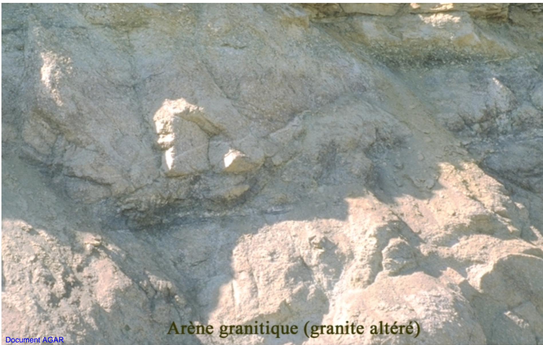
Arène granitique (granite altéré)